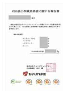
CO 2 削減効果報告書

PCをリユースする事が直接CO 2 の排出削減に寄与します。新製品の資源採掘からの製造工程とリユース処理工程のCO 2 排出差異を、リユース効果として数値に換算したCO 2 削減効果報告書をお客様毎に提出致します。